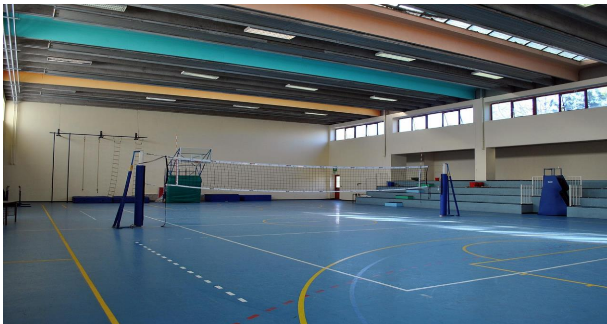
Palestra della sede Giorgi

L'Istituto "Giovanni Giorgi" aderisce inoltre di anno in anno alle attività promosse da Comune e Provincia di Roma, Regione Lazio, Ministero della Pubblica Istruzione, Università e da tutti gli organismi ed enti pubblici, indirizzate ai giovani e finalizzate ad arricchire e qualificare il loro percorso d'istruzione e formazione come studenti e cittadini.