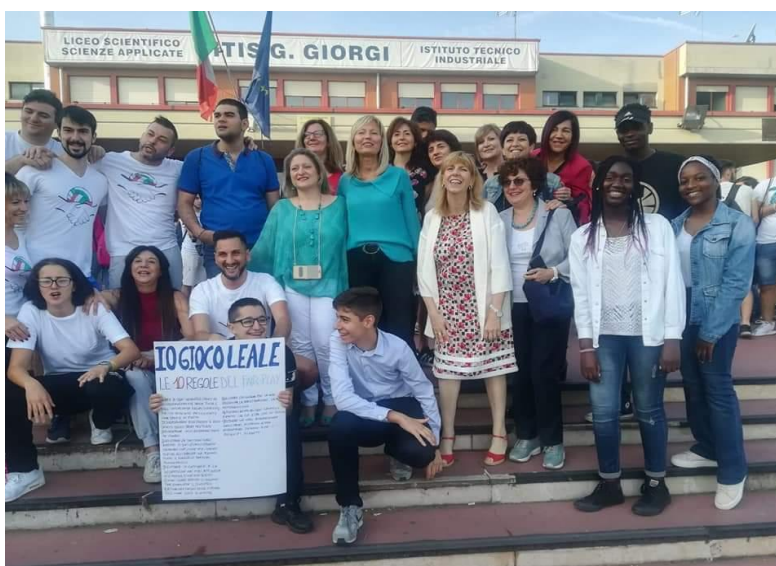
Iniziativa "Io gioco leale" per la legalità ed il contrasto al bullismo

Realizzazione di un giornale scolastico con la partecipazione di docenti e studenti.