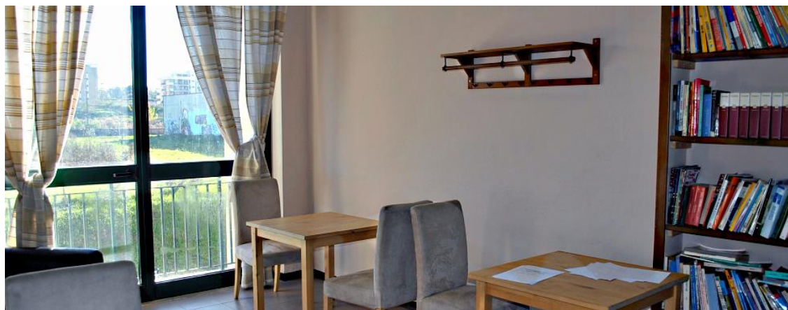
Spazi per colloqui con i genitori sede Giorgi

Il Liceo Scientifico delle Scienze Applicate NON HA IL LATINO che viene sostituito da INFORMATICA e da un incremento delle attività laboratoriali delle materie scientifiche e da una solida preparazione in Matematica, Chimica, Fisica e Scienze che saranno fondamentali per superare i test di AMMISSIONE ALL'UNIVERSITA'.