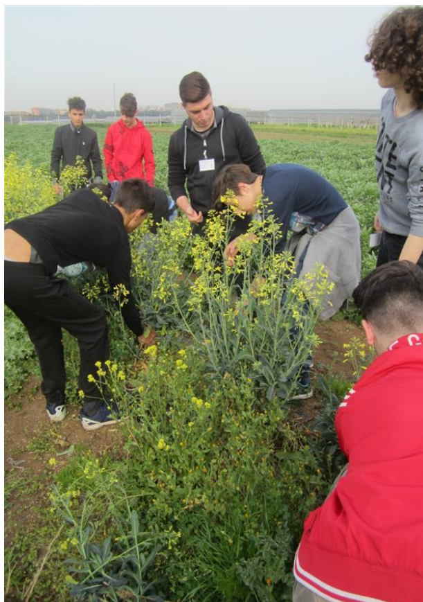
attività PCTO alla tenuta "La Mistica"