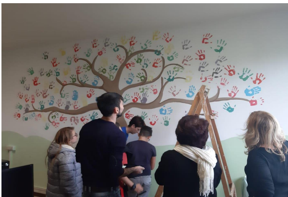
murale della sala polifunzionale sede Giorgi