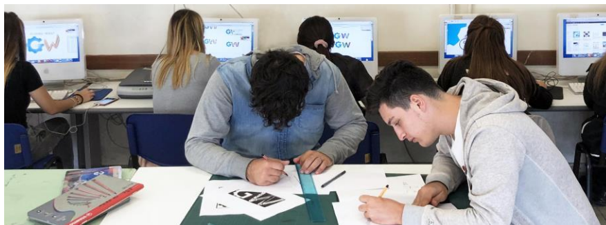
Elaborazione settore Grafica sede V.Woolf