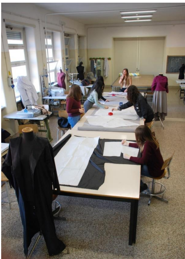
attività di laboratorio sartoriale sede Woolf

Vengono inoltre promosse attività finalizzate alla formazione del cittadino attraverso le attività promosse dalla Biblioteca, la realizzazione di convegni e mostre a carattere storico, sociale e religioso, nonché lo stimolo ad acquisire comportamenti consapevoli nei confronti della tutela della salute. (svolte secondo le modalità della normativa Covid-19)