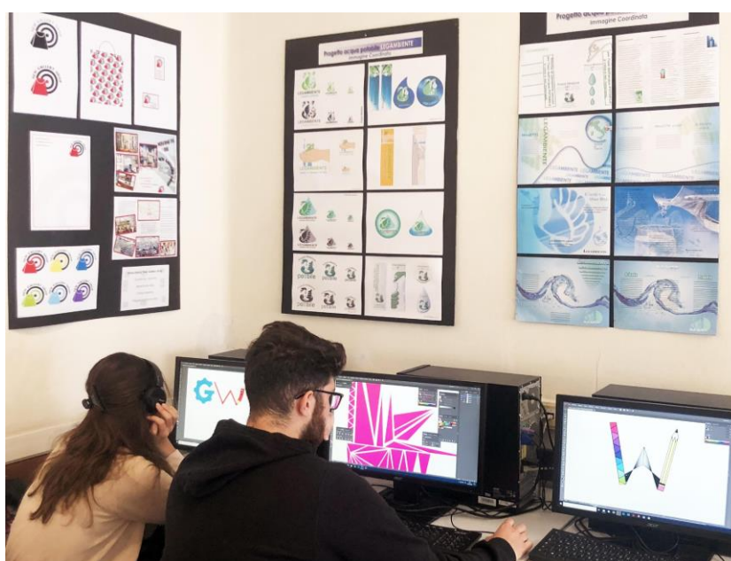
Settore Grafica sede V.Woolf