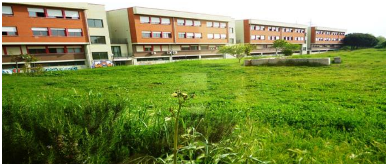
Area verde interna alla sede Giorgi

3. Presso l'istituto è inoltre attivo un centro di ascolto psicologico CIC finanziato dalla scuola in cui opera una dottoressa psicoterapeuta dell'adolescenza a disposizione di studenti, genitori e personale tutto. (vedi 5.2, Attività: CIC)