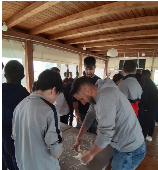
PCTO presso tenuta Mistica

Le attività previste per legge di PCTO (ex " Alternanza scuola-lavoro ") sono realizzate specificatamente per gli alunni diversamente abili attraverso la collaborazione con la cooperativa "Capodarco" (sede Mistica), e con l'ipermercato "Esselunga" - sede Prenestina /Palmiro Togliatti (attualmente non attivo per la normativa Covid-19)