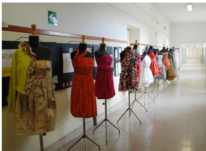
Modelli di sartoria presso sede V. Woolf