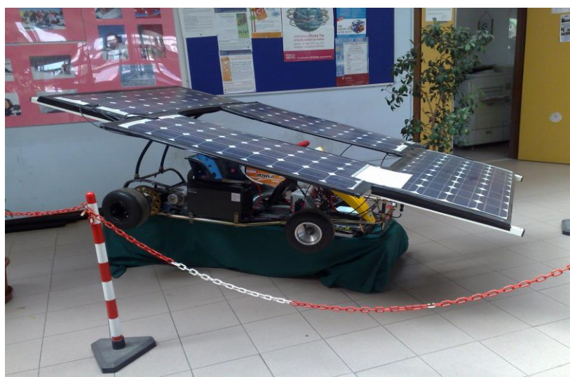
Go-kart ad energia solare realizzato dagli studenti del G.Giorgi