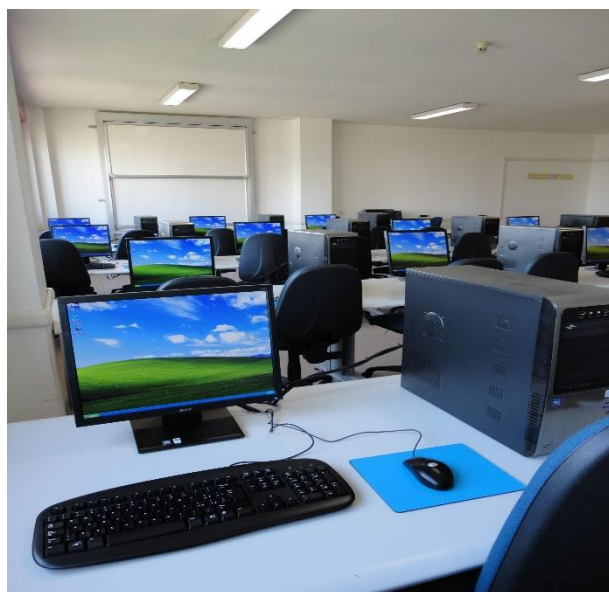
Laboratorio di informatica sede G.Giorgi