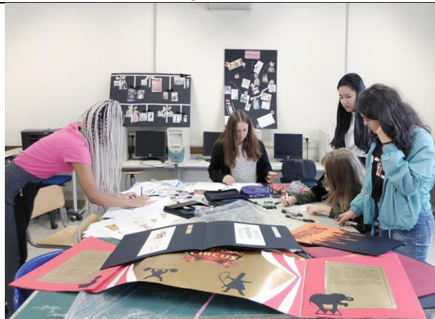
Settore Moda V. Woolf

Tutti i percorsi di istruzione e formazione presso l'IIS "Giorgi-Woolf" sono di durata quinquennale, si concludono con l'Esame di Stato, permettono l'accesso all'Università in qualunque dipartimento, prevedono la possibilità dell'esercizio della libera professione (corsi IT e IP) e/o l'inserimento in qualsiasi ambiente di lavoro.