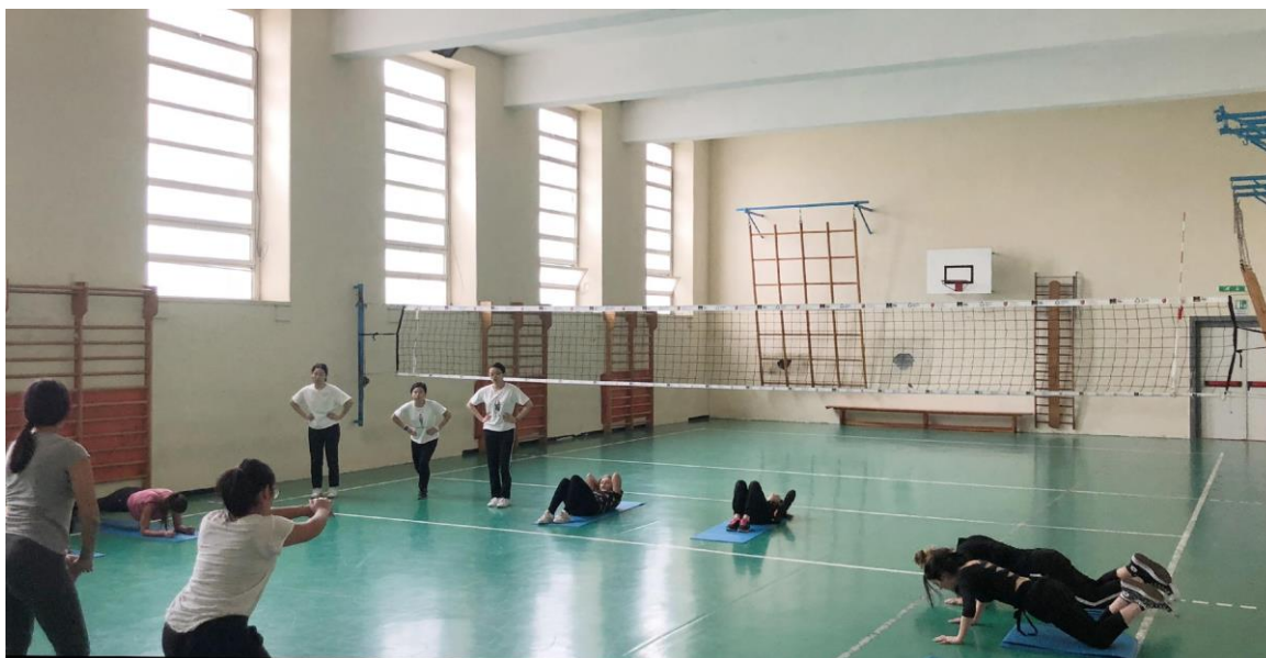
Palestra del V. Woolf