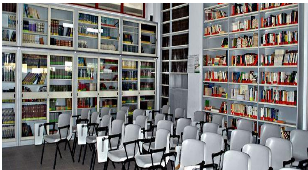
Biblioteca della sede Giorgi

La Biblioteca rimane aperta in orario pomeridiano , secondo modalità comunicate con apposita circolare annuale, per offrire agli studenti un adeguato spazio di studio attrezzato e con la supervisione di un docente. (Attività temporaneamente sospesa)