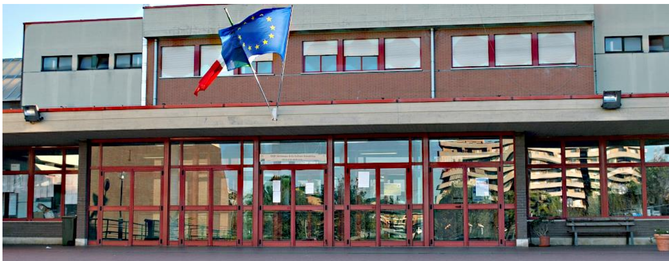
ingresso della sede centrale Giovanni Giorgi

Il P.T.O.F. è reperibile sul sito web della scuola www.iisgiorgiwoolf.edu.it e su http://cercalatuascuola.istruzione.it/cercalatuascuola/