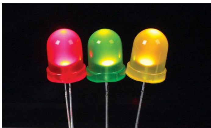
Esercitazioni con luci a led sede G.Giorgi