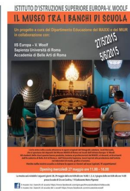
Il museo tra i banchi di scuola