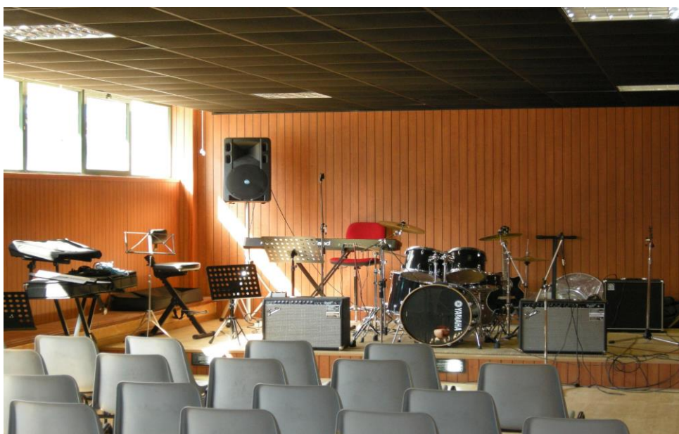
Sala musica della sede Giorgi

In ottemperanza alle specifiche direttive, il personale docente ha seguito appositi Corsi di informazione sanitaria Covid-19. Durante l'A.S. 2020/21, inoltre, verrà effettuato un corso sulla Sicurezza nella Didattica Digitale Integrata